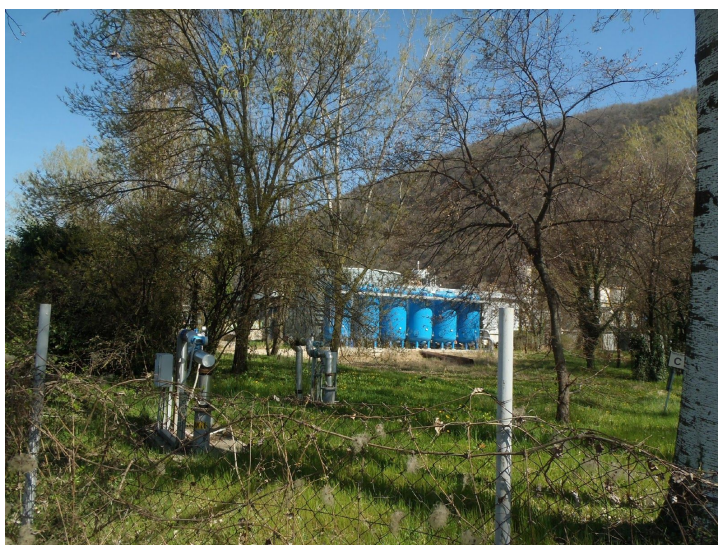
Foto: Pozzi della barriera idraulica 2 di Miteni (in primo piano) e 6 serbatoi della "fase 4" dei filtri a carbone attivo, installati dopo il 2015.